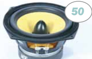
17-cm-Tieftöner im Vergleich